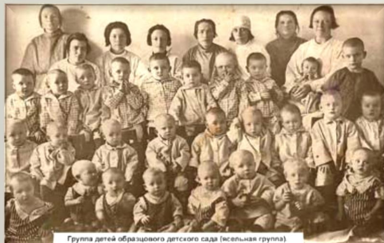
Группа детей образцового детского сада [ясельная группа]