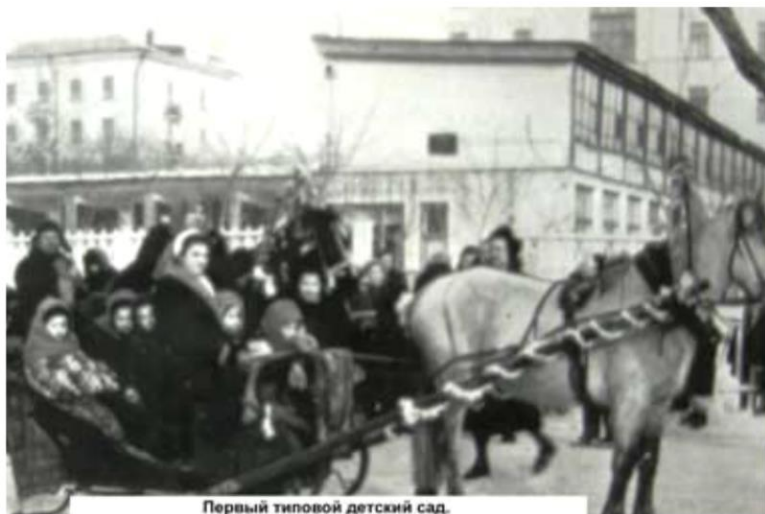
Первый типовой детский сад.

Первый однокомплектный детский сад в Кузнецке был открыт 30 сентября 1930 года при педагогическом техникуме .